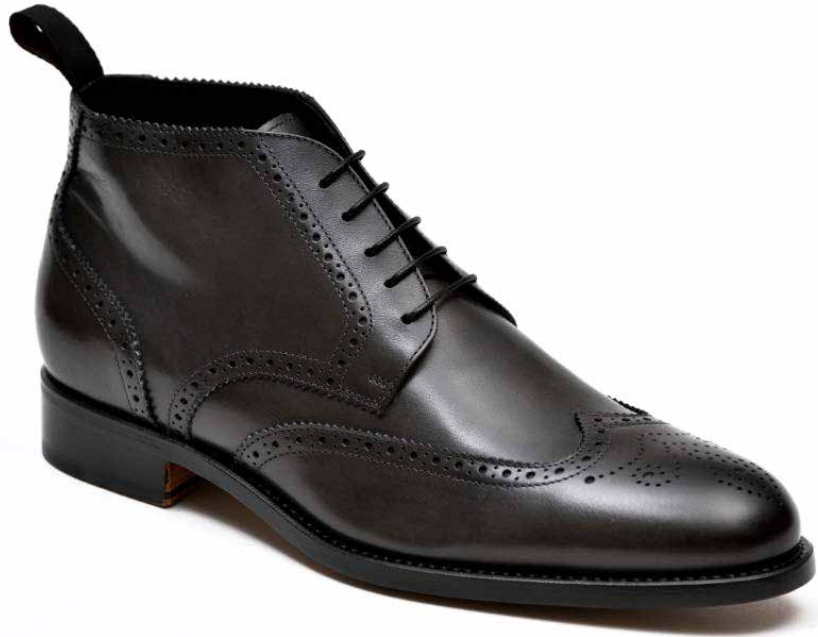
DERBY ANKLE BOOT