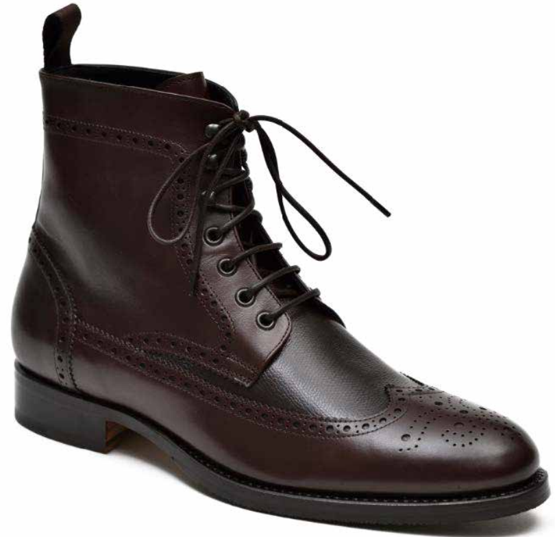
DERBY FULL BROGUE BOOT