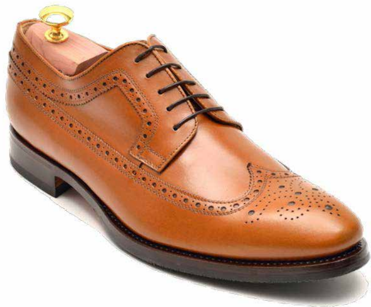
DERBY FULL BROGUE LONGWING